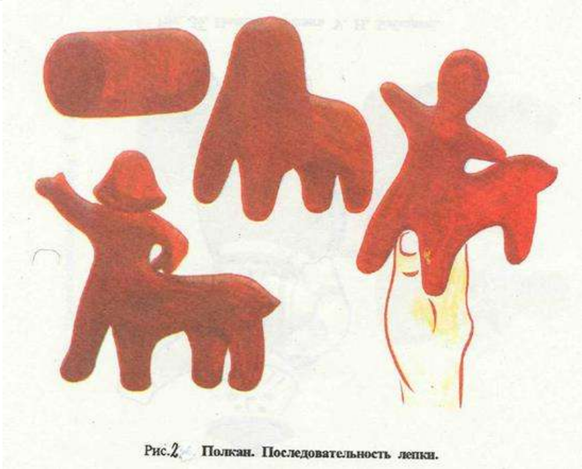
Рис. 2. Полкан. Последовательность лепки.